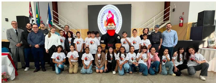
Por Wagner D'Antonio

Programa fortalece a cidadania, incentiva escolhas conscientes e reafirma o compromisso com a formação de crianças e adolescentes