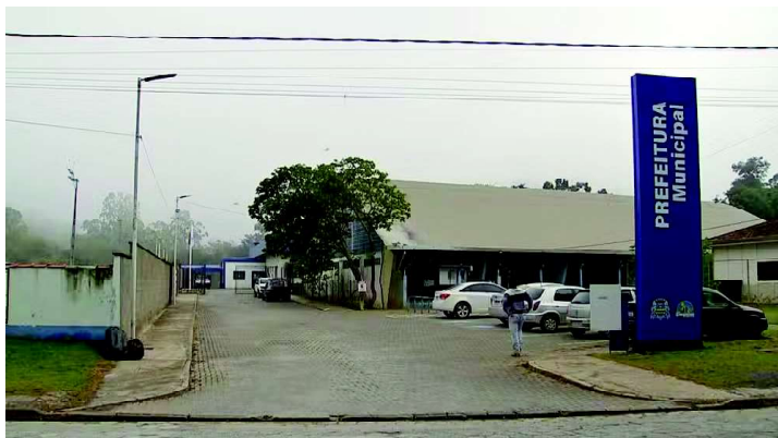
Prefeitura de Guapiara (SP) passou a utilizar como Paço Municipal o prédio que deveria abrigar o CAPS

"Compromete-se, ainda, no prazo de 60 dias, reestabelecer a disponibilização de transporte e o fornecimento de refeições aos usuários, de acordo com o projeto terapêutico singular de cada um, de modo que os pacientes assistidos em um turno (4 horas) recebam uma refeição diária, e os em dois turnos