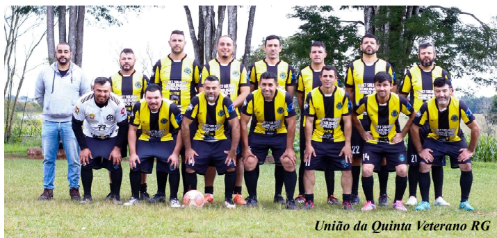
União da Quinta Veterano RG

Antes do início da segunda fase, a última rodada da fase classificatória da categoria Veterano foi realizada no