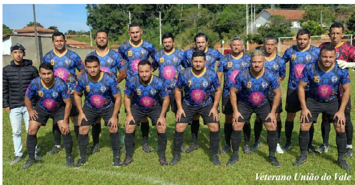
Veterano União do Vale