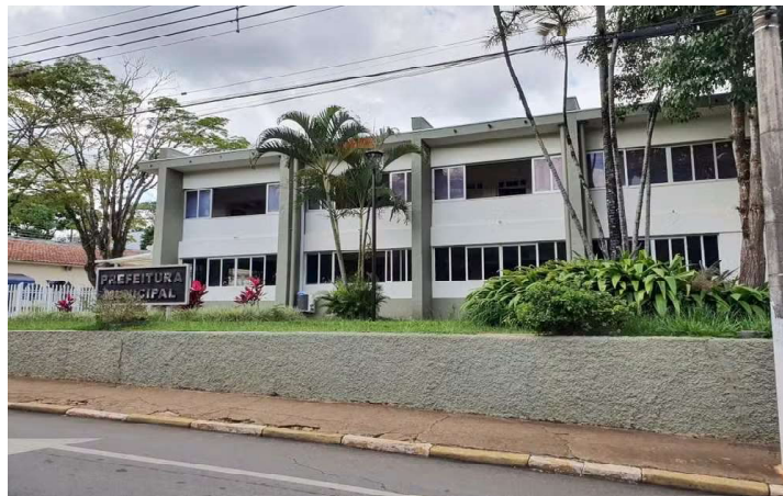
Prefeitura de Capão Bonito contrata profissionais especializados após atuação do MP

Além do concurso público e das formações em educação especial, o termo estabeleceu a ne-