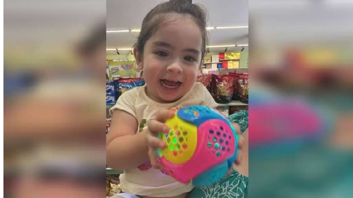
Família denuncia omissão de socorro após morte de menina de 2 anos em UPA de Itapeva

Durante esse período, o quadro da menina piorou, evoluindo para crises convulsivas, insuficiência respiratória e paradas cardiorrespiratórias. Segundo a prefeitura,