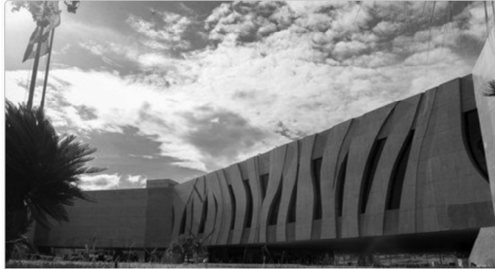
Decisão foi tomada pela 5ª turma do STJ