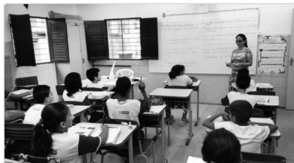
PEC vai permitir acúmulo de cargos de professores

A comissão especial da Câmara dos Deputados aprovou nesta quarta-feira (13) o relatório da PEC (Proposta de Emenda à Constituição) que permite a acumulação de cargos de professores com outro de qualquer natureza. Atualmente, a Constituição permite o acúmulo de dois cargos de professor ou para cargos técnicos ou científicos. Agora, o texto segue para o Plenário da Câmara. A proposta elimina a restrição imposta aos professores e permite a acumulação com outro cargo. Segundo a relatora, Maria Rosas (Republicanos-SP), "a vedação tem por finalidade garantir a eficiência no exercício das atribuições